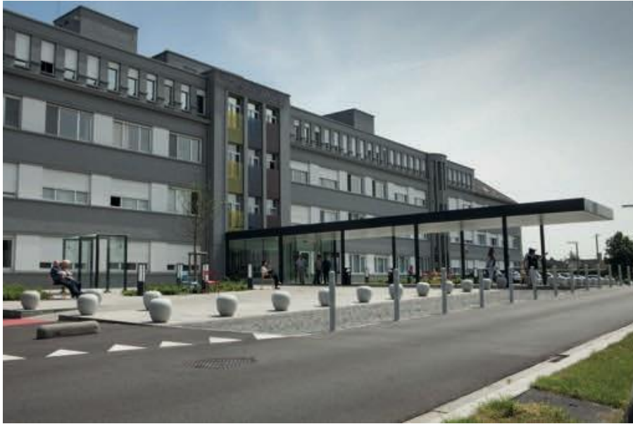
O.L.V. Van Lourdes Ziekenhuis - Waregem Weight Clinic